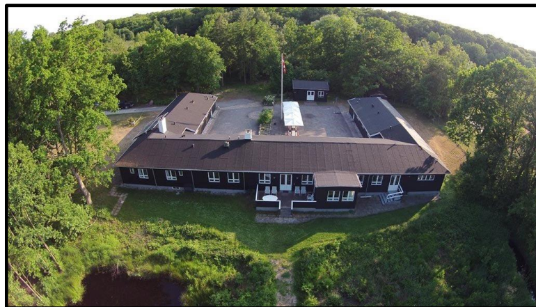
Ulvshale strand – kolonien

Uge 32, afgang mandag d. D. 3. august til torsdag d. 6. august. Målgruppe: kommende 4. og 5. klasse (er den ikke fyldt op kan andre tilmelde sig). Destination: Ulvshale strand på Møn.